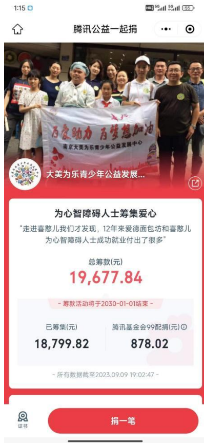
带着团队为心智障碍人士筹款